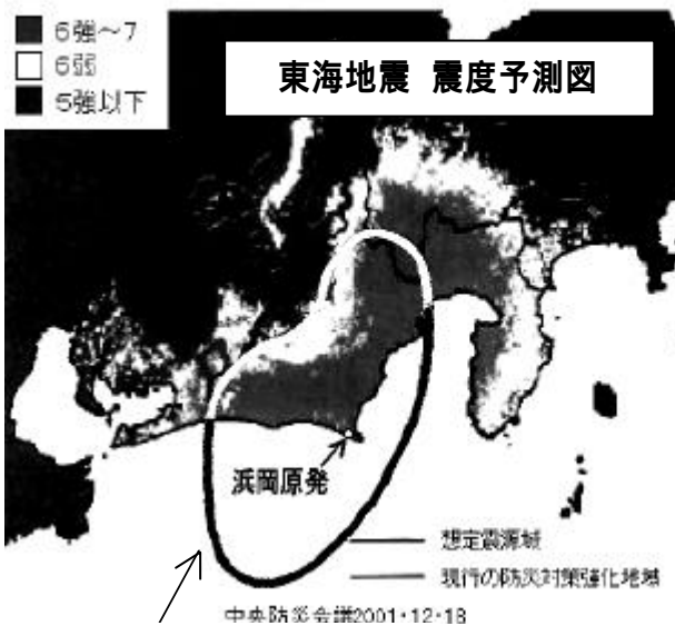
太線が想定震源域